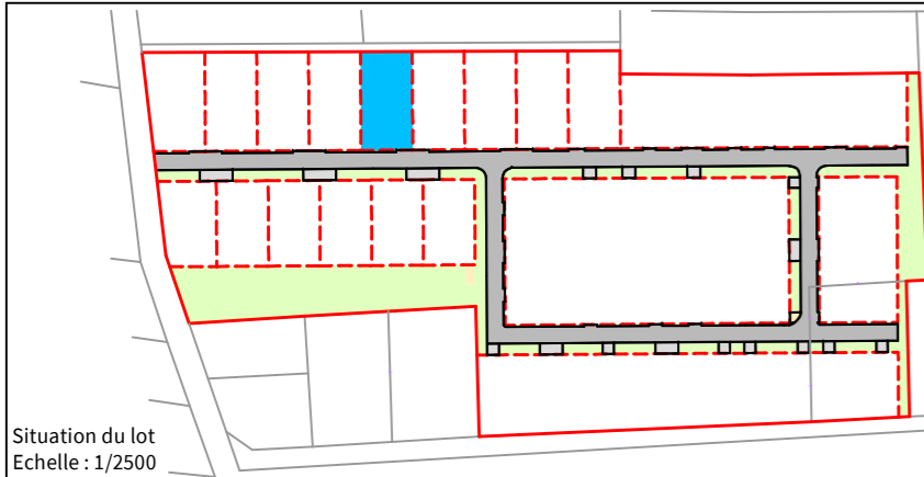
Désignation des sommets du lot aux 10/01/2023 et 06/02/2023